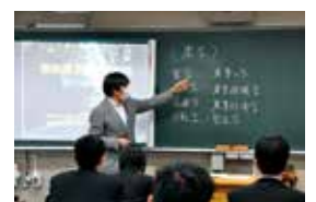
大学の先生による模擬授業