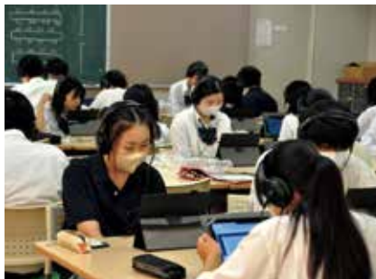
オンライン英会話レッスン