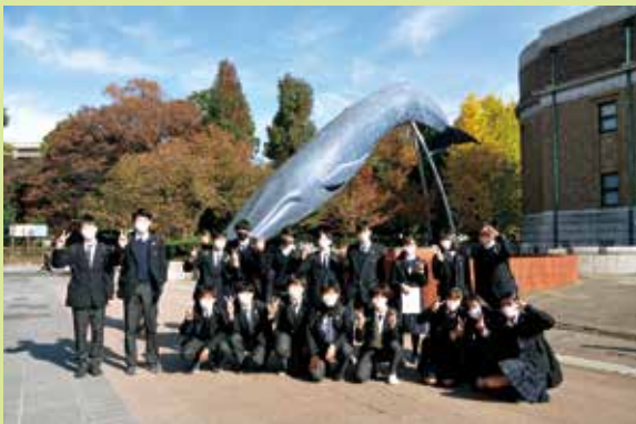
▲校外学習 上野公園 国立科学博物館