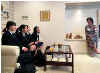
ヨルダン大使公邸訪問