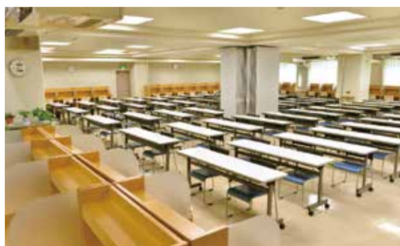
◆ 自習室の完備 ◆