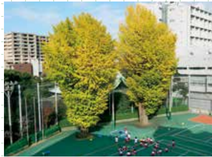
▲上野高校のシンボル 大銀杏