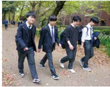
▲登校風景（新緑の上野公園）