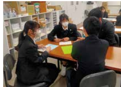
第6回 東京都高等学校英語ミニビブリオバトル大会 最優秀賞