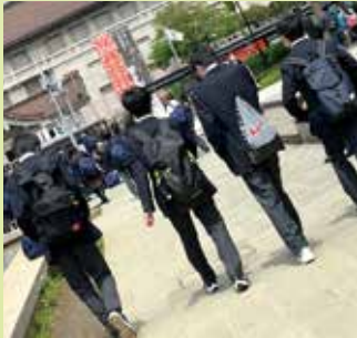
▲校外学習 上野公園 東京国立博物館へ

上野公園という立地の良さから上野高校を志望しました。東京国立博物館や国立科学博物館などに足繁く通って、上野の地を存分に楽しんだ感じです。特に東京国立博物館の法隆寺宝物館は心を落ち着かせるのに最適な場所であったし、季節によっては開放される庭園も気に入っていました。こうした立地の良さは上野高校の大きな特徴の一つなのではなかろうか。こうした贅沢な環境のおかげで、とても文化的な生活が送れ、授業以外のことでも知見を広めることができたと思っています。