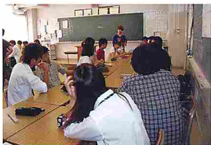
縦割りホームルーム (7月)