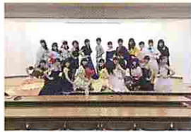
ファッションクリエイティブ部