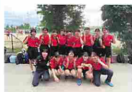
女子ハンドボール部