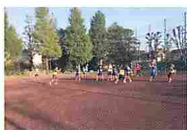
男子ハンドボール部