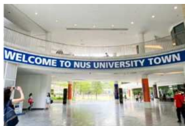
シンガポール国立大学見学