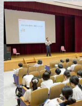
千葉大学模擬講義