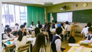
オンラインによる説明

学問的興味・関心が近い人で班を編成し、問いをたて、探究活動に取り組んでいきます。千葉大学との連携により、大学教授の講義を聞き、大