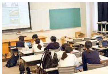
現地校とのオンラインミーティング

訪問前に現地校生徒とのオンラインミーティングや英語プレゼンテーション講座、帰国後は英語でのポスター発表やプレゼンテーションを行います。