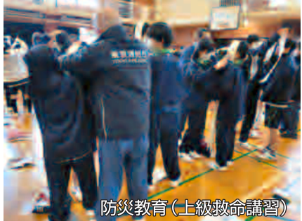
防災教育（上級救命講習）