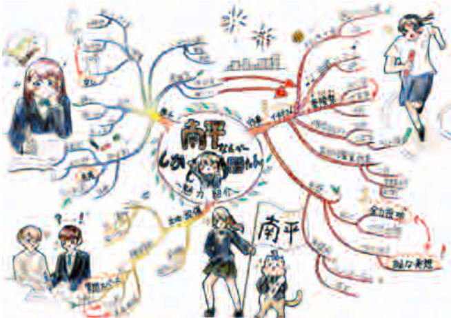
イラスト：川鍋 小春