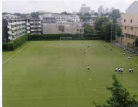
人工芝のグラウンド