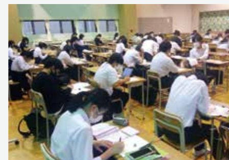
生徒ホール(自習室)