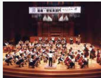
駒場フィルハーモニーオーケストラ部