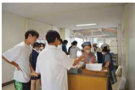
購買 お昼休みにお弁当や軽食、パンなどを購入することができます。