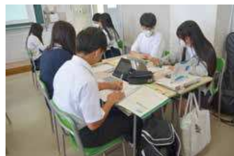
1人一台端末を活用した授業