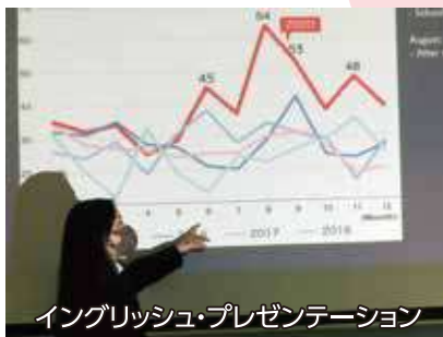
イングリッシュ・プレゼンテーション

広く深い外国語授業の数々で 様々な言語を学んだり、外国語能力を より高めたりすることができます。