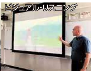
ビジュアル・リスニング

探究心を突き詰める授業も多数あり、 進学に必要な深い学び・手厚い指導で、 自分がより気になる分野を学ぶことが可能です。