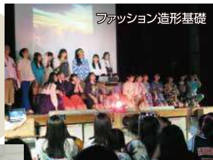
ファッション造形基礎

他校では見られないユニークな授業も。スポーツや文化芸術分野への進学にも対応できます。