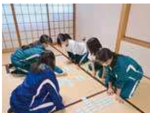
伝統文化（かるた・和太鼓）部