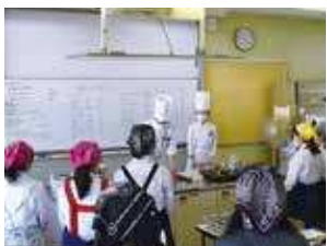
ハンドメイキング部