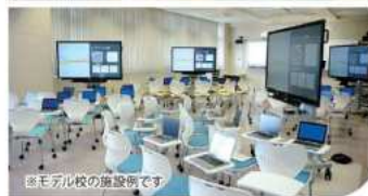
※モデル校の施設内です。