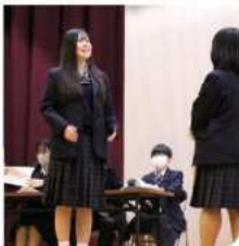
スピーチコンテスト

合唱祭ではクラス全員で何度も練習を重ね、美しい合唱を創り上げました。ホールに響き渡るみんなの歌声はとても感動的でした。