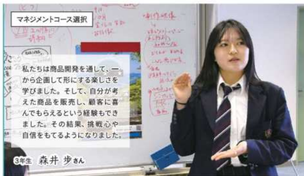
マネジメントコース選択

私たちは商品開発を通して、一から企画して形にする楽しさを学びました。そして、自分が考えた商品を販売し、顧客に喜んでもらえるという経験もできました。その結果、挑戦心や自信をもてるようになりました。