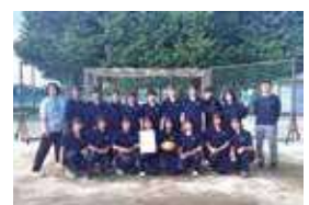
女子ハンドボール部