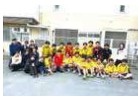
男子ハンドボール部