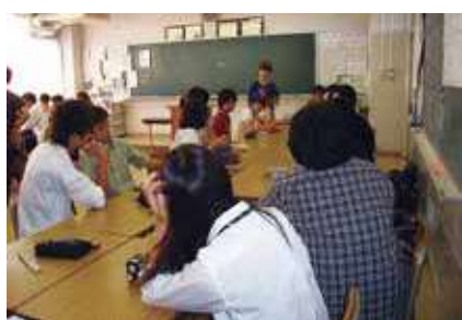
縦割りホームルーム（7月）