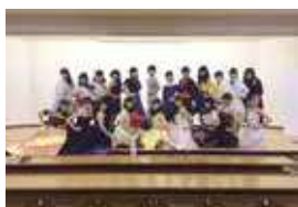
ファッションクリエイティブ部