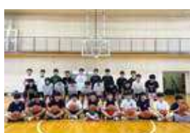
男子バスケットボール部