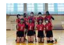
女子バレーボール部