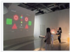
1 学年遠足 お台場