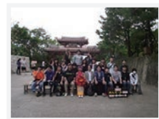
4 学年修学旅行 沖繩