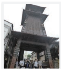
2 学年遠足 川越