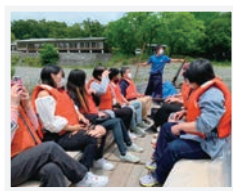
4 学年遠足 長瀬