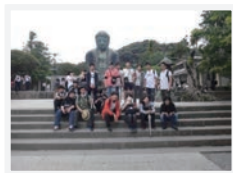
3 学年遠足 鎌倉