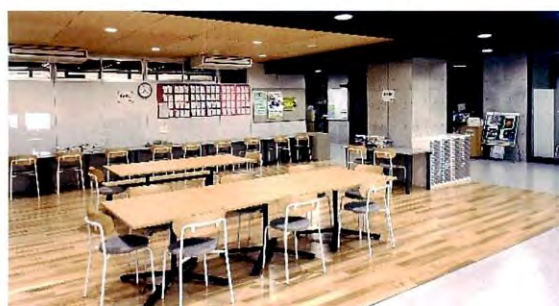
自習や面談が可能なラーニング・コモンズ