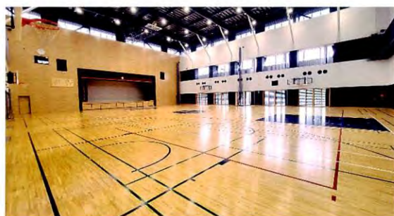
公式戦も実施可能な体育館