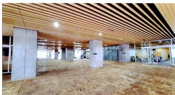
正門から吹き抜けの昇降口(豊島アベニュー)