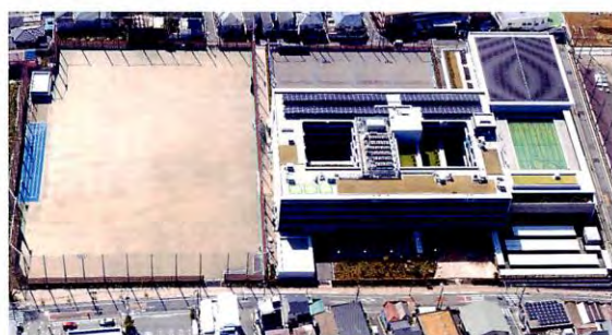
令和6年3月にグラウンドが完成