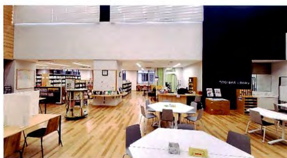
自習スペースを完備した採光のある図書室