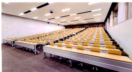
324人が収容できる視聴覚室