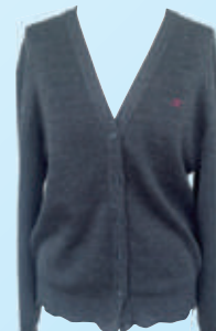
カーディガン 〈グレー・紺〉