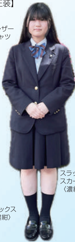
スラックス・ スカート 〈濃紺〉