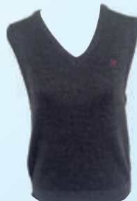
ベスト 〈グレー・紺〉