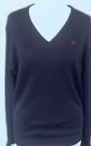
セーター 〈グレー・紺〉