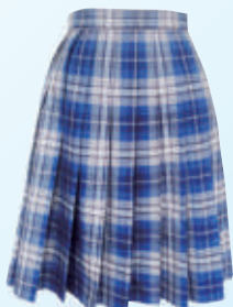
スカート 〈チェック〉