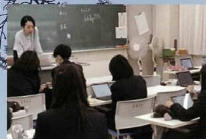
ICTを活用した個別最適な学び