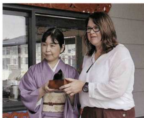
ニュージーランド グレイマウス高校