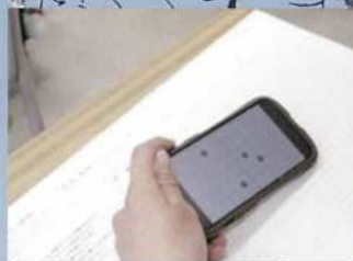
動画を活用した実習

多摩の教員は授業づくりにこだわります。対話を通して、生徒のつまづきポイントを知り、生徒の思考の流れを熟慮した授業をデザインしています。生徒が「わかった」と言う瞬間の笑顔を見るために、授業創りを全校体制で取り組んでいます。