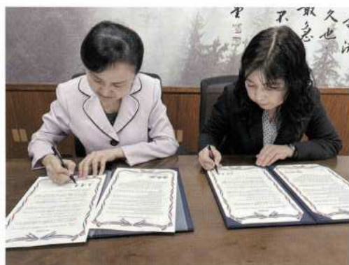
台湾台北市立 南湖高級中學（高校）

グローバル人材育成に関する取組み 令和5年度に姉妹校締結 オンラインによる交流や交換留学プログラムを実施予定