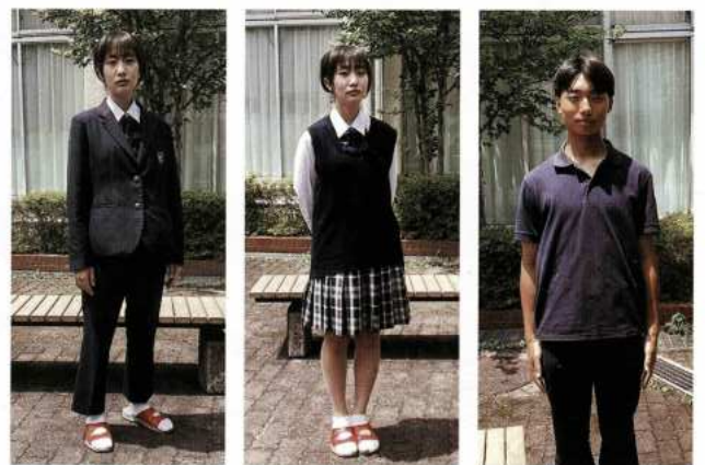
夏用にポロシャツがあります。