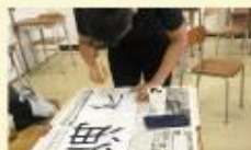
日本語・日本文化研究部