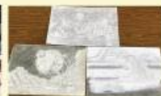
美術・イラスト部