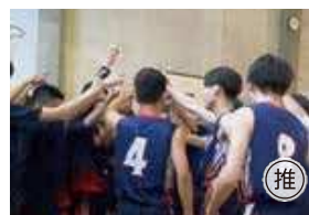
● 男子バスケットボール