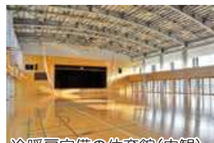
冷暖房完備の体育館(内観)