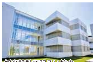
採光設計で明るい校舎

平成23年に体育館、平成25年に校舎棟、そして平成26年にグラウンドが完成。まだ新しい、きれいな施設です。