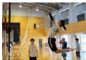
● 男子バレーボール