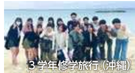
3 学年修学旅行 (沖縄)