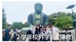
2 学年校外学習 (鎌倉)