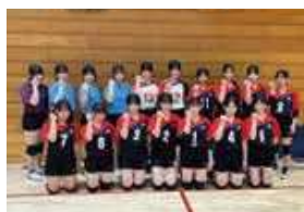
● 女子バレーボール