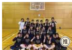
● 女子バスケットボール