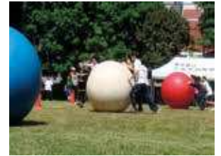
スポーツフェスティバル