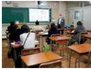
進学・就職ガイダンス