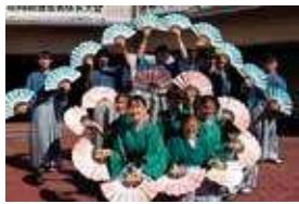
吟詠剣詩舞同好会