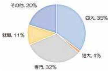
図 令和5年度進路実績