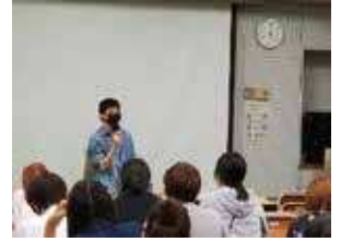
卒業生のお話を聞く会