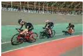
自転車競技同好会