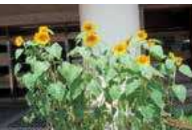
ボランティア同好会