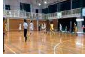
バスケットボール部