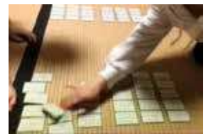
競技かるた同好会

活動を通じて、自分のやりたいこと、自分に合うこと、安らぎの場所・友人を見つけよう！ そして、大きな可能性をもつ自分を認め、未来に向かって更なる挑戦をする意欲や態度を身に付けよう！ 授業、学校行事とともに、部活動でも充実した学校生活を送りましょう！