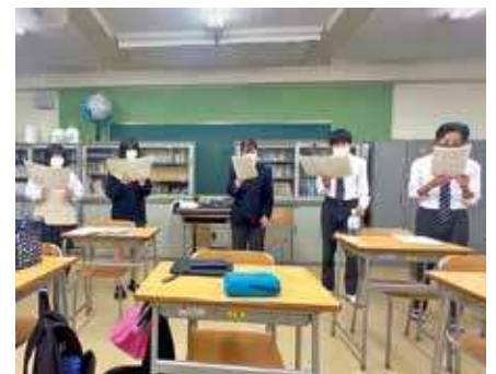
ハーモニーを楽しんでみませんか。初心者も歓迎です！