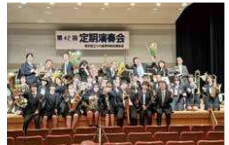
「一音入魂！」をモットーに、日々活動しています。学年を越えてのアンサンブル・合奏を通し、人的にも大きく成長しています。音楽、吹奏楽が大好きで興味がある人は是非！経験は問いません。