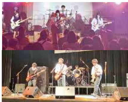
音を学び、音を楽しむ。