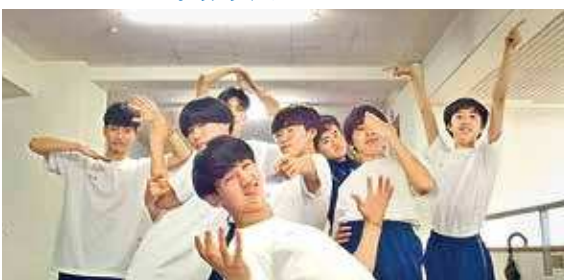
ダンベルを使って筋肉を成長させたい人・今の自分を乗り越えたい人は集合！！