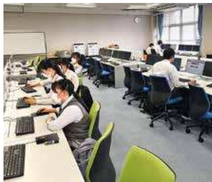
あなたと一緒にPC部！！