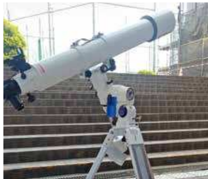
星や化石に興味のある者集まれ！