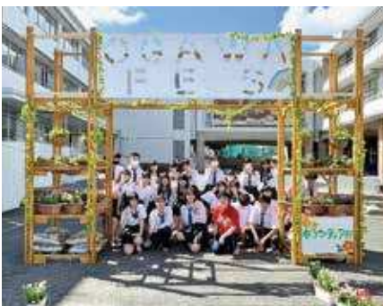
「雨にも負けず」コツコツ小さな努力をしています。