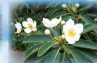
ムニンヒメツバキ 小笠原固有種で村の花。