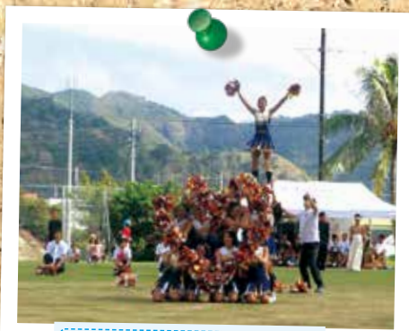
チアリーディング部