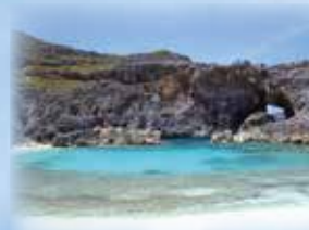
南島の扇池 父島の南にある石灰岩の無人島。島自体が特別天然記念物になっています。