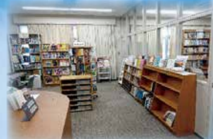
図書室 新着図書も数多くあり、地域の方へも開放されています。