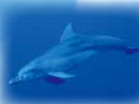
ミナミハンドウイルカ ドルフィンスイムで人気。イルカは父島で一年中見ることが出来ます。

海洋島である小笠原には多くの固有種が生息しています。2011年、世界自然遺産に登録されました。