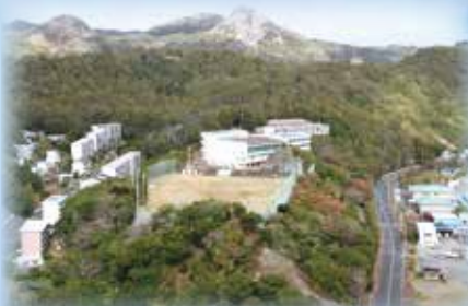
校舎 高台にあり、地域の防災拠点となっています。