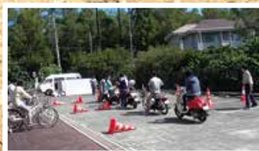
警察官による交通安全教室