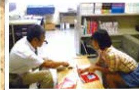
生徒一人一人に対し、充実した進路指導を行うことが出来ます。

生徒全員が、自らの進路を決め、努力し、勝ち取り、卒業していくことを目指しています。