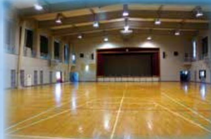
体育館 バスケット・バレー・バドミントンコートがとれます。