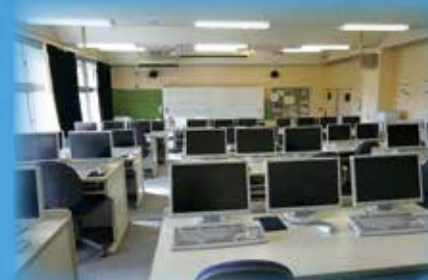
視聴覚教室 インターネットは光回線につながっています。