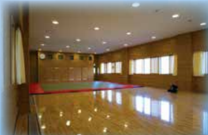
武道場棟 武道場棟には柔道場・剣道場・音楽室が設置されています。