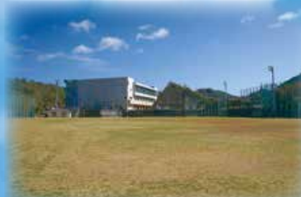
グラウンド 広大な芝生のグラウンドです。