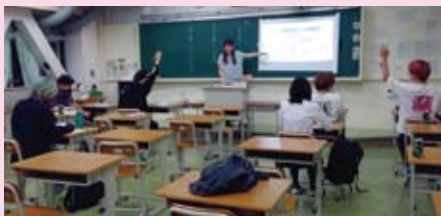
▲授業風景（教室での授業・国語）

丁寧なわかりやすい授業を行っています。普通科の学習は中学校の教材をより深めていくものです。普通科・食品化学科とも1～2年次の数学は習熟度別の授業により余裕を持って理解できるようにしています。授業だけではよく分からなくても、休み時間や放課後を使って先生が教えてくれます。生徒一人一人の進み具合に応じた指導も行われています。卒業後には、大学に進学する生徒もいます。