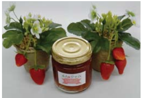
本校のジャム (生産品)