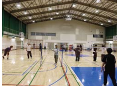
生徒会主催行事 (新入生歓迎レクリエーション)