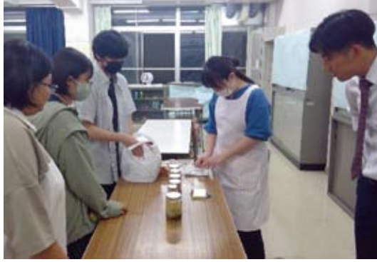
放課後の活動 (研究中ピーマンジャムの試食会)

本校の給食では、季節感のある作り立ての給食を提供し、食育を進めています。(無償) ※令和6年度入学生の学校徴収金は、食品化学科 88,300 円、普通科 76,300 円でした。