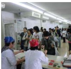
農高祭 (食品化学科生産品販売)