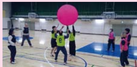
▲授業風景（体育・キンボール）