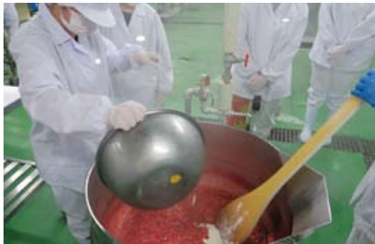
食品化学科によるジャムの製造

近隣の福祉施設と連携した地域貢献活動を実施しています。本校食品化学科の生徒が製造したジャムと福祉施設のパンを融合させてコラボ商品を販売しています。その他、普通科と食品化学科が合同で地域清掃活動も行っています。