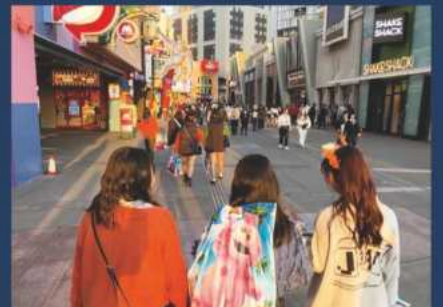
修学旅行 関西地方 (USJ)