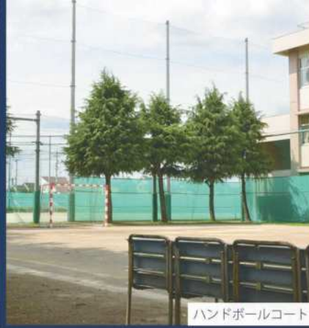
ハンドボールコート