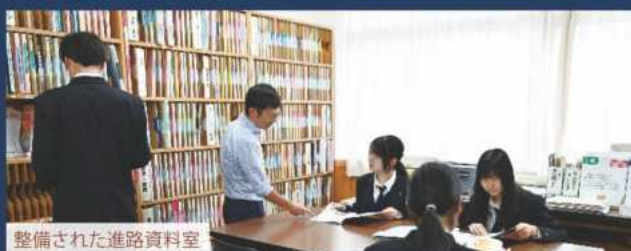
整備された進路資料室