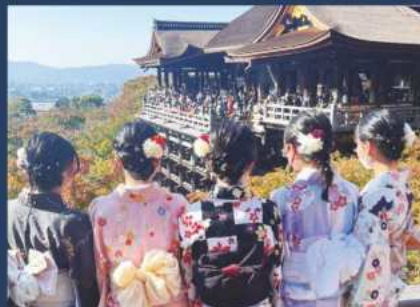
修学旅行 関西地方 (京都)