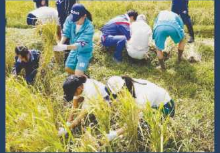
人間と社会 稲刈り