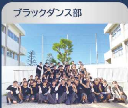
ブラックダンス部