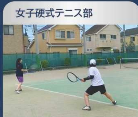
女子硬式テニス部