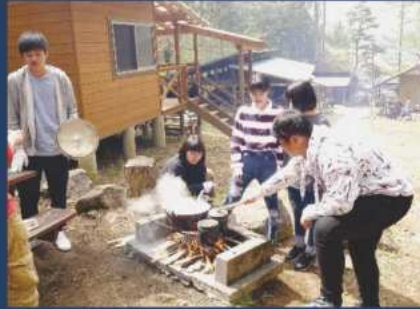
遠足 バーベキュー・散策