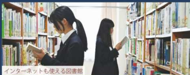
インターネットも使える図書館