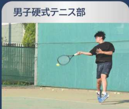
男子硬式テニス部