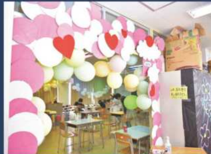
文化祭 クラス展示 (縁日)