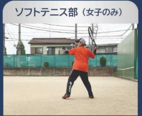
ソフトテニス部 (女子のみ)