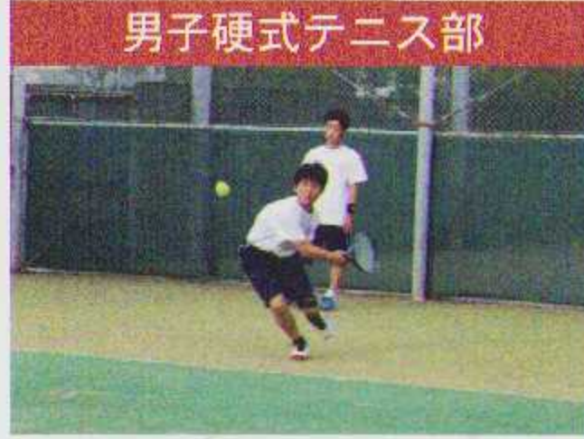
男子硬式テニス部