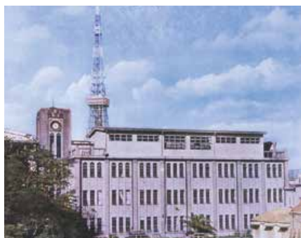
昭和40年ごろの校舎

本校は大正12年(1923年)に東京府立第六高等女学校として開校しました。校章の6枚の花弁も第六高女に由来したなでこの花をモチーフにしています。開校の翌年、現在の敷地に新校舎を建てて移転し、戦後、昭和25年(1950年)1月に都立三田高校と改称しました。同年4月には男女共学の新制高等学校となり現在に至ります。令和5年6月に100周年記念式典を挙行し、Society5.0の社会を創り出す人材を育成すべく、次の100年に向けて動き出しました。