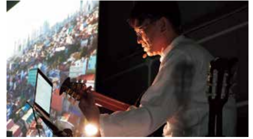
「地球のステージ」による公演

世界と触れ合える1日を目指し、様々なワークショップや講演などを行っています。ここ数年は世界各地で医療と援助活動を続けている日本人医師による「地球のステージ」が中心となっています。ライブパフォーマンスや映像作品に触れることで、いま世界で何が起きているか、また個人がどのように関われるのかについて考え、改めて今後の日本を担うグローバル市民としての自覚を高める貴重な機会となっています。