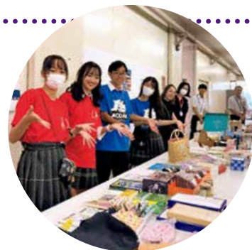
文化祭でのバザー

国際理解委員会は、海外からの訪問者との交流会を企画運営し、おもてなしをする実践的な経験ができる委員会です。1学年の英語落語講演会や各学年のスピーチコンテストの運営などにも関わります。