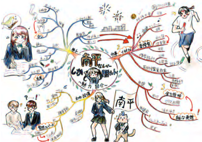
イラスト：川鍋 小春