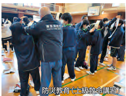
防災教育(上級救命講習)