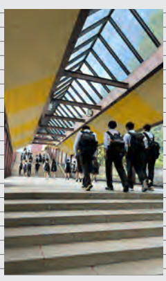
その他(私立、他道府県)