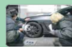
キャリア体験活動