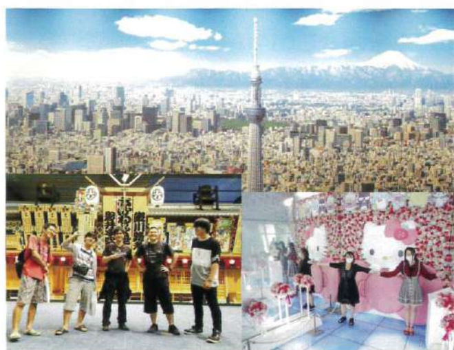
[下町散策、スカイツリー（4年生）]