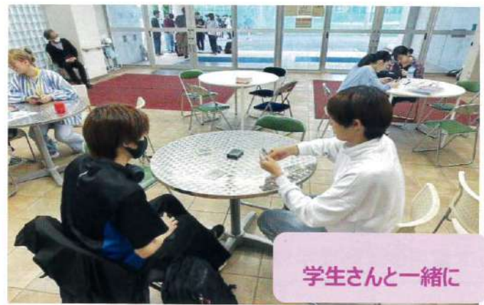
学生さんと一緒に