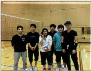
バレーボール 同好会