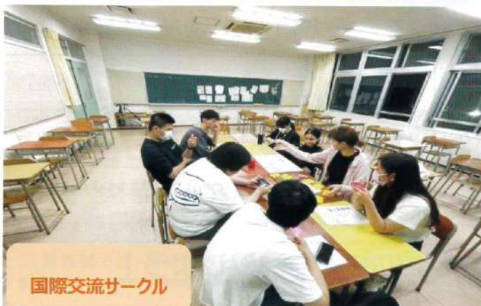
国際交流サークル