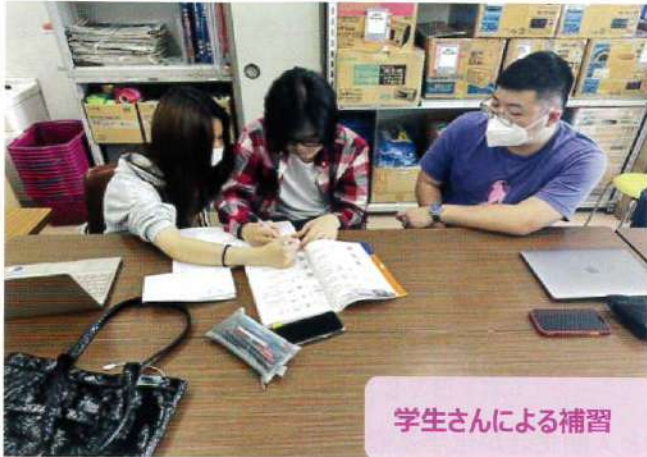
学生さんによる補習