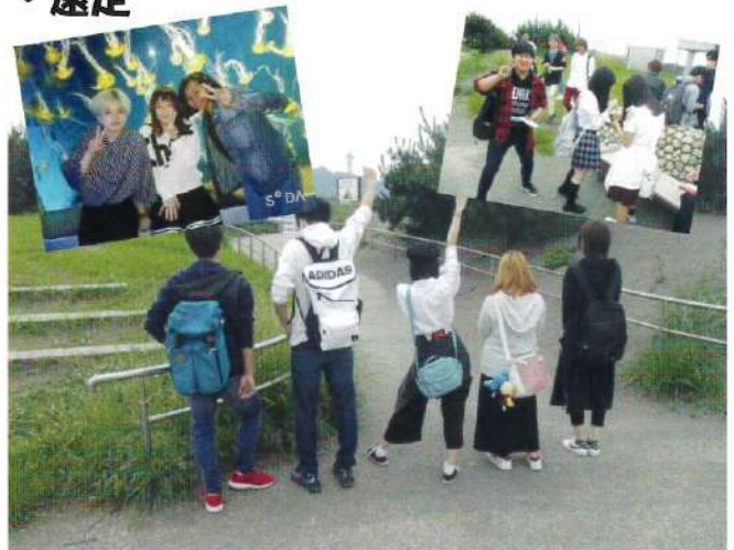
[江の島 (1年生)] 年によって変わります