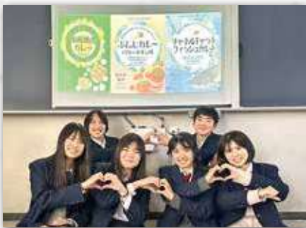
ぶんじカレープロジェクト