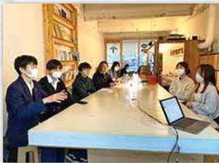
建築×まちづくりプロジェクト