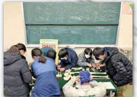
日本モンキーセンター霊長類骨格標本の観察