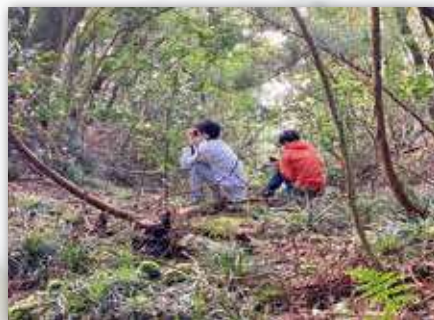
カラスバト屋外調査