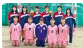
女子ハンドボール