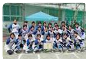
女子ソフトボール