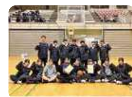
女子バスケットボール