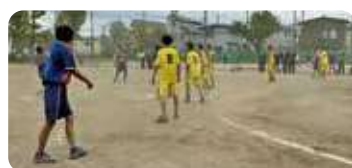
男子ハンドボール