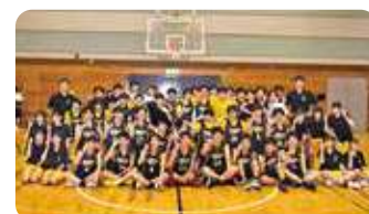
男子バスケットボール