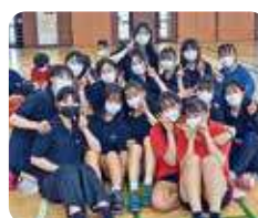
女子バドミントン