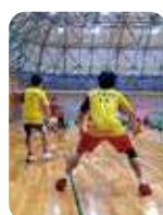
男子バドミントン