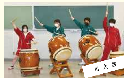
和太鼓 ～響け 奏でろ 魅せろ～