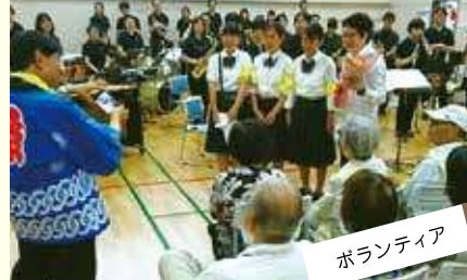
ボランティア 進んで手を挙げ、誰かを助けられる人に。