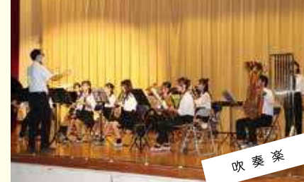
吹奏楽 みんなで力を合わせて美しいハーモニーを響かせる。