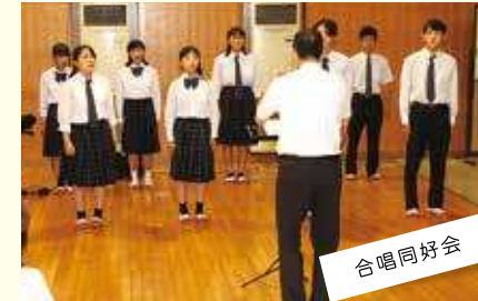
合唱同好会 皆の声を合わせて、すてきな響きを奏でます。