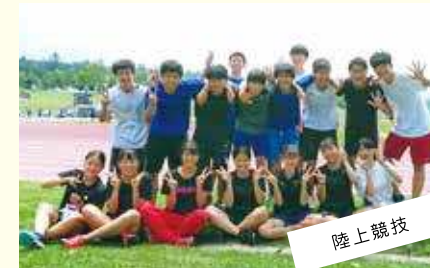
陸上競技 都大会・関東大会への出場