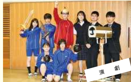
演劇 目指せ 中央大会出場!!