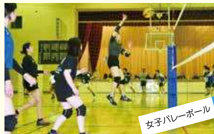
女子バレーボール 熱き闘志を胸に、共に闘い、共に輝く!