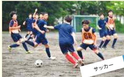
サッカー 「Respect(大切に思うこと)」