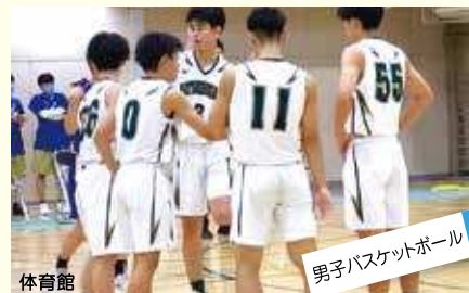
男子バスケットボール 上手くなるより強くなれ。努力!根性!!忍耐!!!