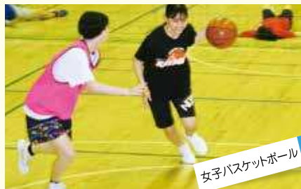
女子バスケットボール 楽しく 仲良く 礼儀良く 1勝でも多く!!