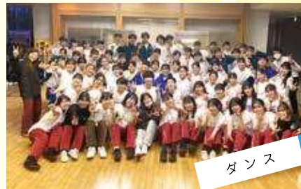
ダンス 全国大会出場。規則正しく学校生活を送り、応援されるダンス部を目指しています。