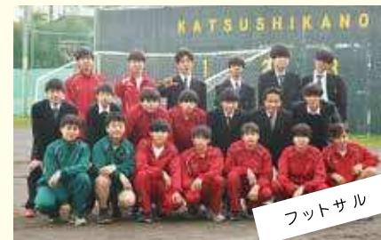
フットサル 楽しく仲良くフットサル!