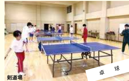
卓球 楽しく活動する。一球一球を大切に。