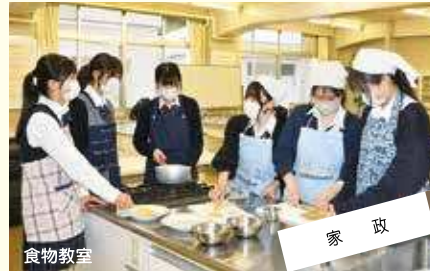
家政 楽しく活動する。