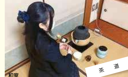
茶道 三年間でお免状を取る。