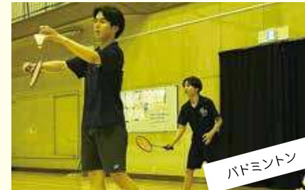
バドミントン みんなが楽しく、声出して活発に。みんなが来なくなる部活。