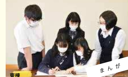
まんが 学年の壁がなく、仲良く自由に、楽しく活動する。