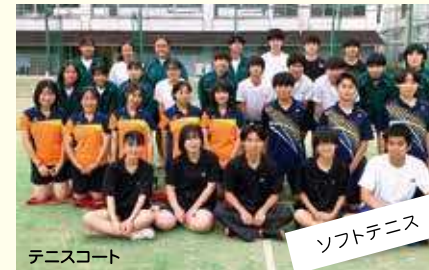
ソフトテニス 国立ベスト16!!