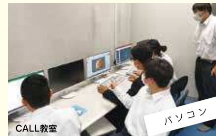
パソコン 楽しく仲良く、スキル向上。目指すは検定合格!!