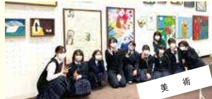
美術 自分の将来に、プラスになる経験を。