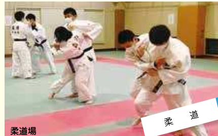
柔道 明るく、楽しく、力強く! 都大会での勝利を目標に