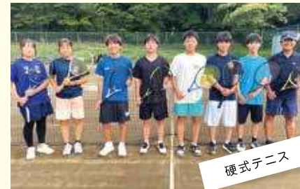
硬式テニス 走れ!打て!目指せ6学区優勝!!