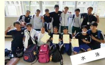
水泳 楽しく、真剣に泳ぐことと向き合おう! 自己ベスト更新、6学区上位入賞、都大会出場&入賞