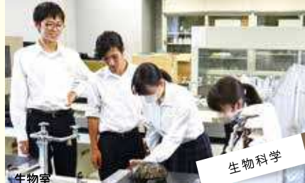
生物科学 普段の研究成果を内外で発表する。