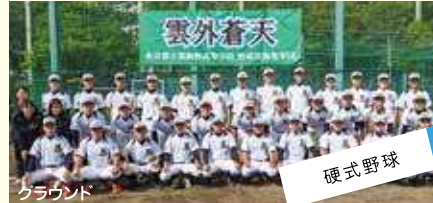
硬式野球 「文武生活三刀流」「都立初の甲子園勝利は葛飾野」