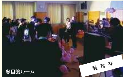
軽音楽 さあ、楽器を持ってバンド演ろう。全員ライブに出る。