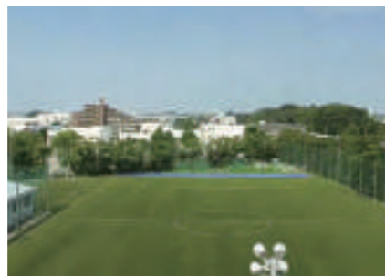
人工芝のグラウンド