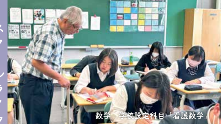
数学 学校設定科目「看護数学」