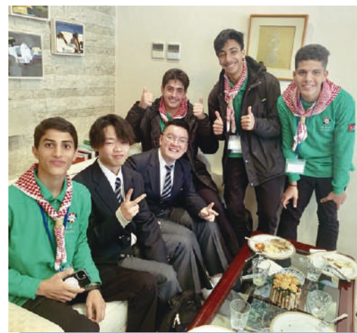
ヨルダン・ハシェミット王国との海外交流

令和6年度は、東京都の事業として行っている東京体験スクールにおいて、ヨルダンからの生徒を迎え入れ、授業や部活動を一緒に体験します。また、海外派遣研修として福生高校の生徒がヨルダンに渡航し、現地でも交流します。