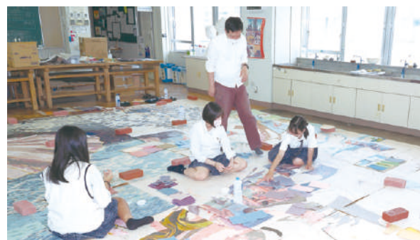
本校での制作風景