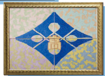
貼り絵交流 横田ハイスクールで校章の 共同制作