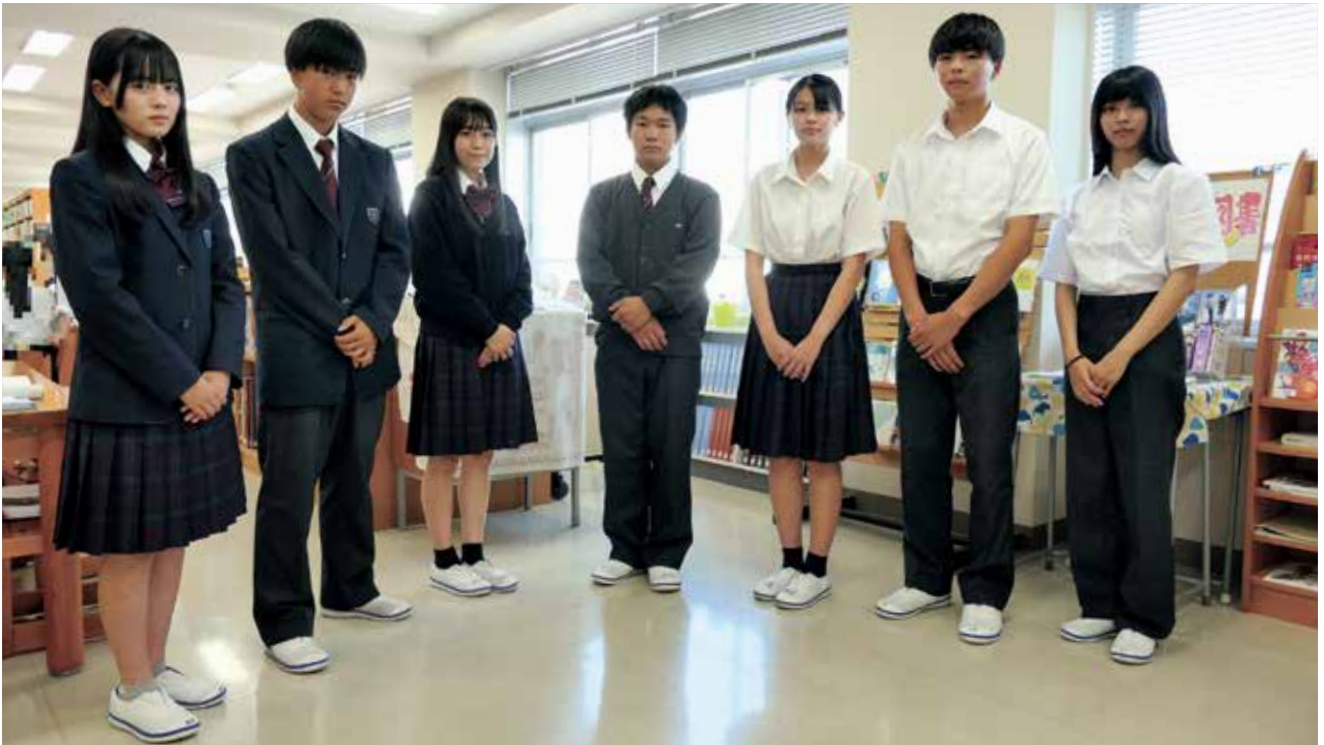
冬服（ブレザー） 冬服（カーディガン、セーター） 夏服 スラックス・スタイル