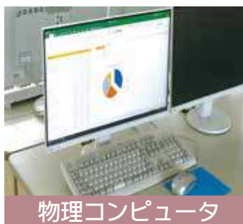
物理コンピュータ