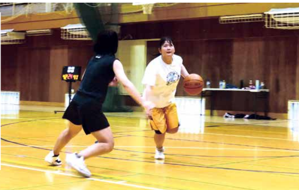
女子バスケットボール