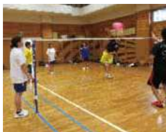
ビーチボールバレー