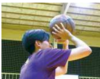
男子バスケットボール