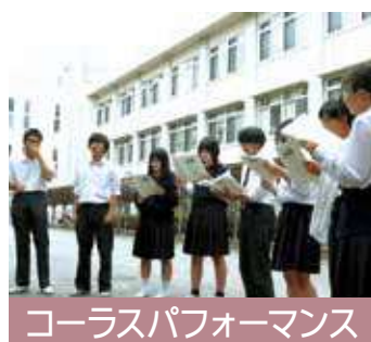
コーラスパフォーマンス