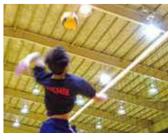
男子バレーボール