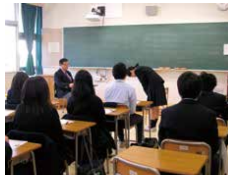
模擬面接(進路指導)