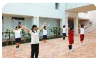
バトントワリング部