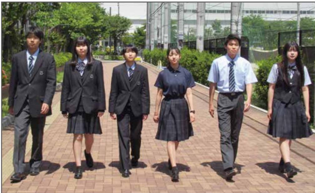
〈左から〉男子冬服、女子冬服、女子冬服（パンツスタイル）、共通ポロシャツ、男子夏服、女子夏服