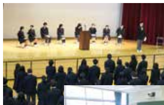
模擬面接(進路学習)