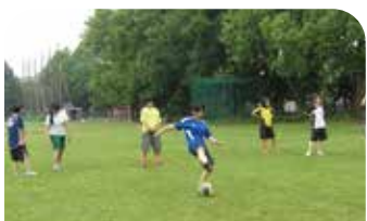
女子サッカー同好会