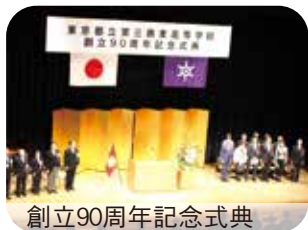
創立90周年記念式典