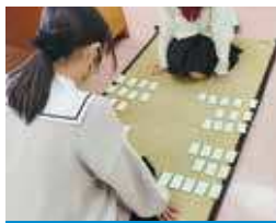
競技かるた同好会