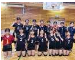
バレーボール部 (男女)