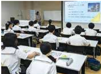
▲ 筑波大学での研究室訪問