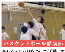
バスケットボール部 (男女)

楽しくメリハリをつけて活動しています。バスケットで青春しましょう！先輩後輩の仲が良く、明るい雰囲気です！