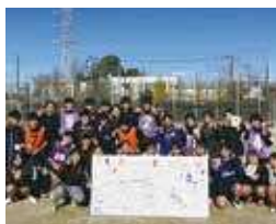
ハンドボール部 (男女)