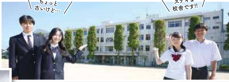
ちょっと古いけど...

土曜授業は年20回ほど、午前中4時間で行われます。その他、校内予備校なども実施します。