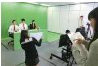
▲ TGG (Tokyo Global Gateway) での体験的学習