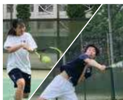
硬式テニス部 (男女)