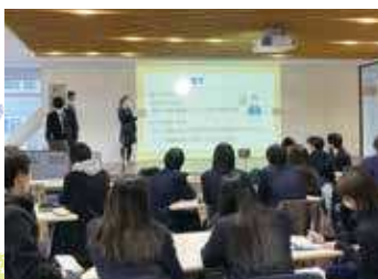
▲ 日本大学文理学部での調布北高校生の発表