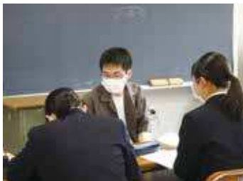
▲ サポートティーチャー

「自主自律、文武両道、文理両眼、グッドトライ」を目標とし、教科横断的な探究活動、大学や地域等と連携した理数教育、キャリア教育、国際理解教育といった教育活動を通じて、自己実現に向け主体的に努力し、他者と協働しながら飽くなき挑戦を続け、社会に新しい価値を提言できる生徒を育成する。