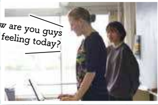
How are you guys feeling today?