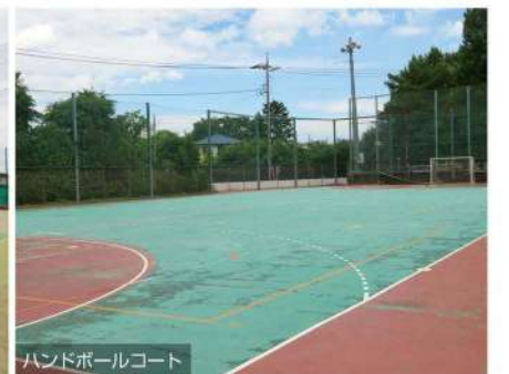
ハンドボールコート