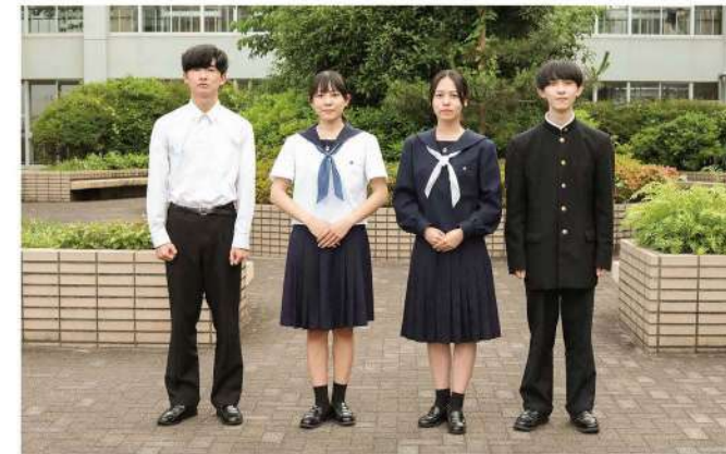
創立以来、70年間受け継がれてきた伝統ある制服です。（夏服・冬服）