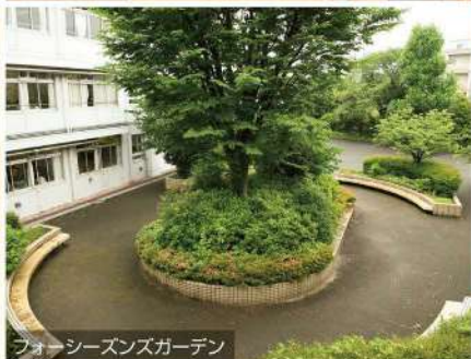
フォーシーズンズガーデン