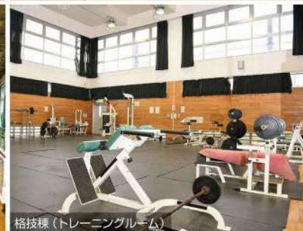
格技種（トレーニングルーム）