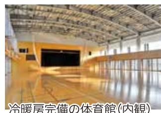
冷暖房完備の体育館(内観)