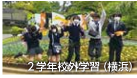
2学年校外学習(横浜)