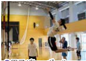
● 男子バレーボール