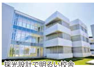
採光設計で明るい校舎

平成23年に体育館、平成25年に校舎棟、そして平成26年にグラウンドが完成。まだ新しい、きれいな施設です。