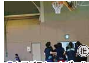
● 女子バスケットボール