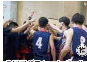
● 男子バスケットボール