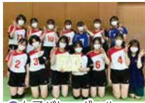
● 女子バレーボール