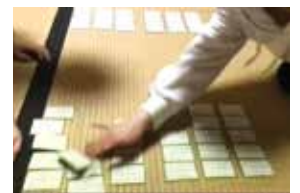
競技かるた同好会

活動を通じて、自分のやりたいこと、自分に合うこと、安らぎの場所・友人を見つけよう！ そして、大きな可能性を持つ自分を認め、未来に向かって更なる挑戦をする意欲や態度を身に付けよう！ 授業、学校行事とともに、部活動でも充実した学校生活を送りましょう！