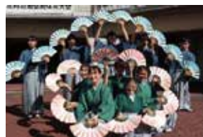
吟詠剣詩舞同好会