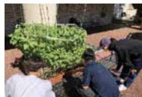
ボランティア同好会