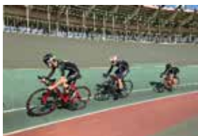
自転車競技同好会