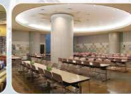
給食室: 広いスペースで食事がとれます