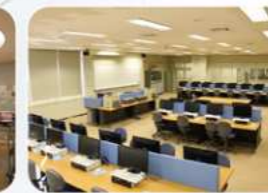
パソコンルーム: 40台設置