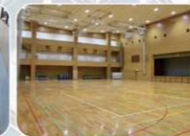
体育館: バスケットコート2面