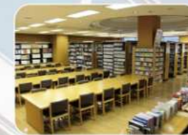
図書館: ゆったりと読書・勉強ができます