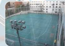
グラウンド: テニスコート3面