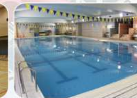
温水プール: 25mコース