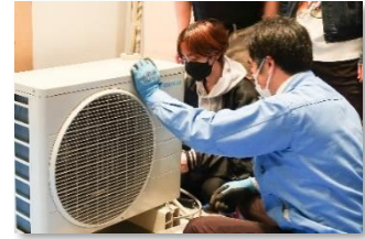
企業体験（エアコン取付工事）