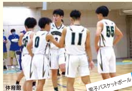
男子バスケットボール