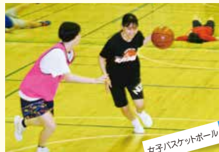
女子バスケットボール