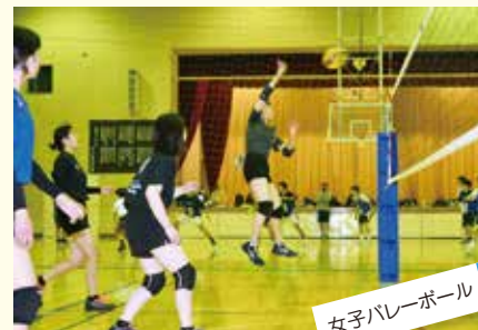
女子バレーボール