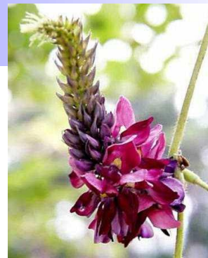
校章の由来 葛(くず)の花