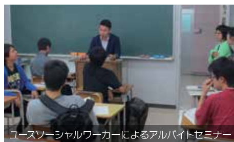
ユースソーシャルワーカーによるアルバイトセミナー