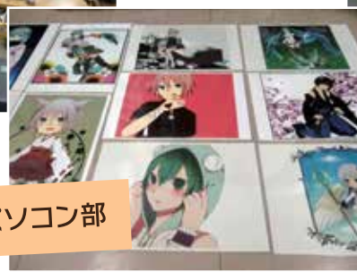
イラスト・パソコン部