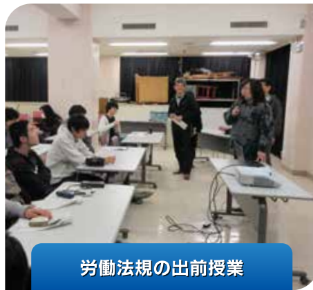
労働法規の出前授業