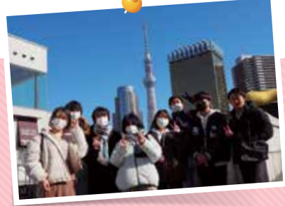
校外学習(浅草方面)