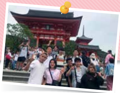
H31 修学旅行(京都・大阪)