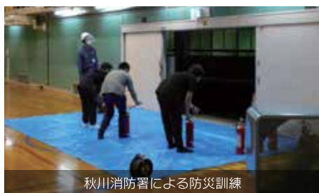
秋川消防署による防災訓練