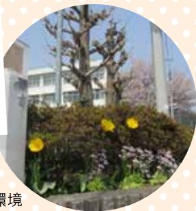
自然に恵まれた環境