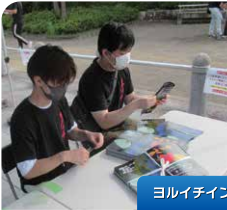
ヨリイチインターンシップ

確かな職業理解と自己理解にもとづき、自らの能力、適性に合ったミスマッチのない進路実現を図ります。