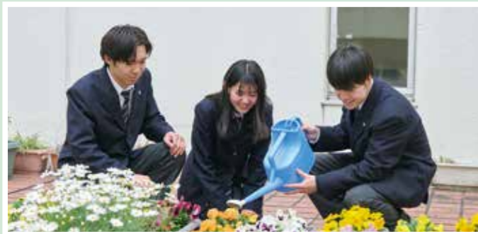
※土曜日は午前中授業 (1~4時限)