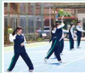
体育の授業。運動に取り組む表情は みんないきいきとしています。