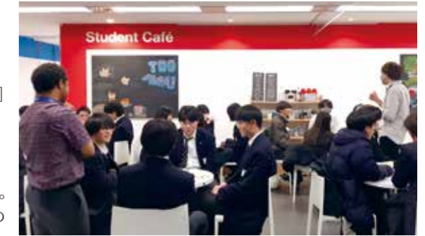
平成30年より TOKYO GLOBAL GATEWAY に参加