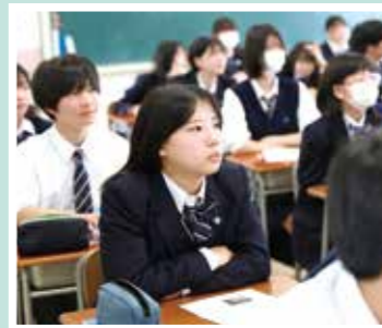
今日の授業はこれで終わり。担任 の先生から連絡事項を聞きます。