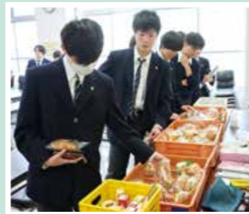
お弁当を持参する他に、食堂の売店 を利用することもできます。