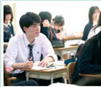
古典総合の授業。授業に向かう 表情はみんな真剣です。