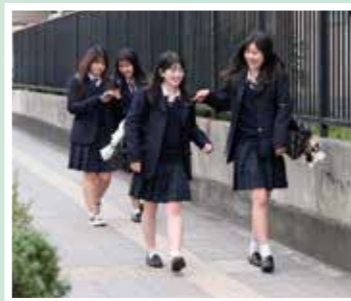
おはよう!!とあちこちで元気な あいさつが聞こえます。