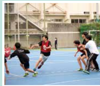
放課後は部活動に参加したり、 自習室で学習することもできます。