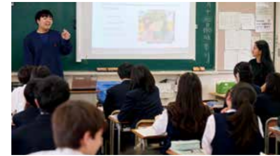
JET (外国人講師) との授業

本校では、平成31年度より実用英語技能検定(英検)を全員受験しています。試験に向けて、授業でライティングや面接試験等の英検対策を行い、生徒の英検取得への意欲を高め、合格に向けて学ぶ機会を広く設置しています。