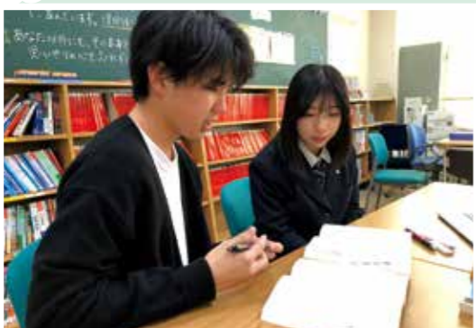
大学生チューター（学習のサポート・進路相談）の配置