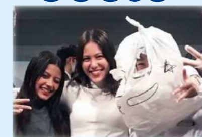
from Italy イタリアより、26期生と共に2022年4月～23年3月の間在学